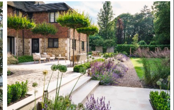
Trädgårdsdesign av PollyAnna Wilkinson

Du är inbjuden till två heldagars seminarium för yrkesverksamma och studerande inom trädgårdsdesign, landskap och anläggning.