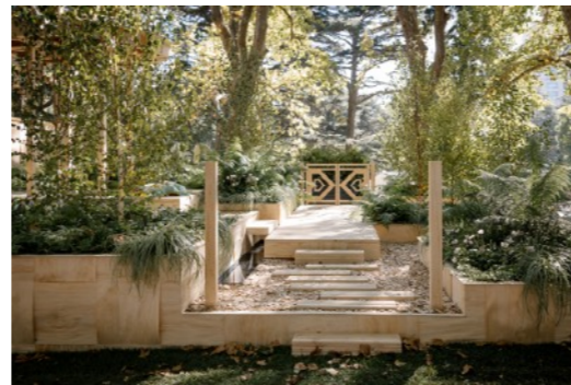
Showgarden av Annika Zetterman